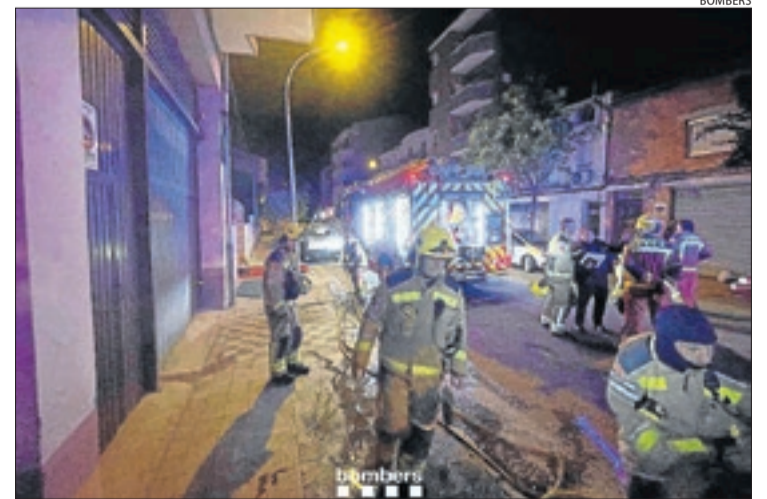
Al foc de Tremp van acudir quatre dotacions de Bombers.

Així mateix, ahir a la matinada hi va haver un altre incendi d'habitatge a la demarcació. Va ser al carrer Barcelona de Tremp i va obligar a desallotjar