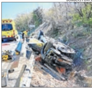
Imatge del cotxe.