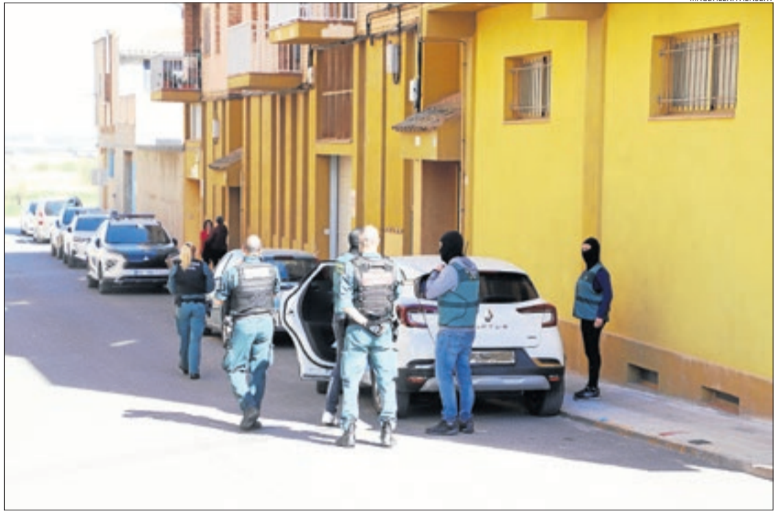
Imatge de la batuda de la Guàrdia Civil que va tenir lloc dijous a Almacelles.

Val a recordar que els Mossos d'Esquadra van desmantellar la setmana passada una altra plantació a Torrebesses en la qual van detenir quatre homes. Havien manipulat una torre de