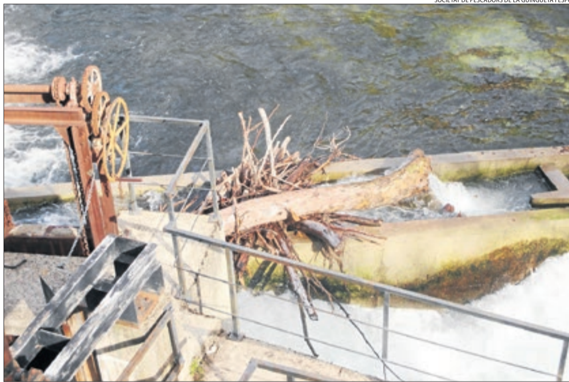
El pas per a peixos al salt de l'Hostalet, obturat per troncs i branques acumulats a sobre.

El pas, entre Sort i Rialp i del qual és titular el primer d'aquests ajuntaments, segons l'ACA, va ser construït el 2018