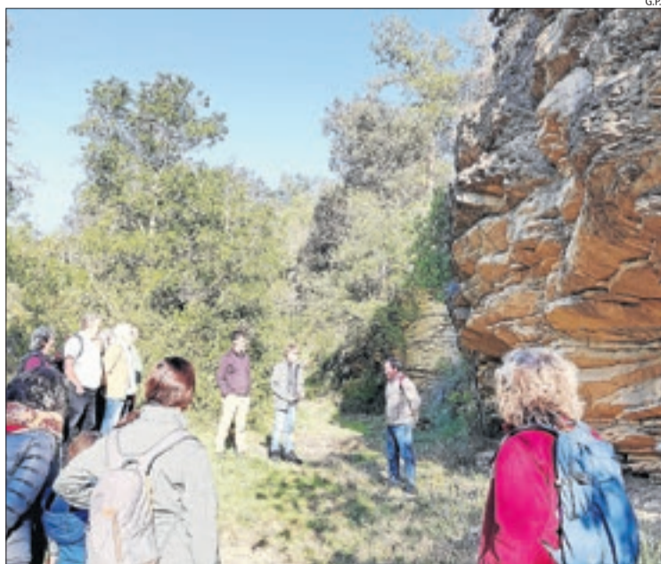
Visita al barranc de la Règola, a la comarca de la Noguera.

dar el patrimoni, principalment geològic i paleontològic, relacionat amb els fòssils de dinosaures, però també de caràcter acadèmic, pedagògic i turístic. D'altra banda, va afegir que la Unesco revisa cada quatre anys les actuacions que s'han fet a tot el territori que inclou el Geoparc per renovar aquesta acreditació, “per això la institució té especial cura amb les mesures necessàries per al seu manteniment”.