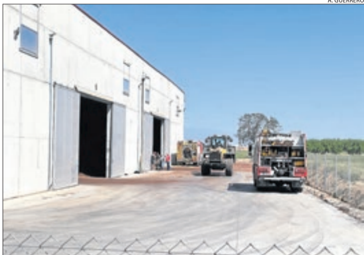
Maquinària pesant va col·laborar en les tasques d'extinció.