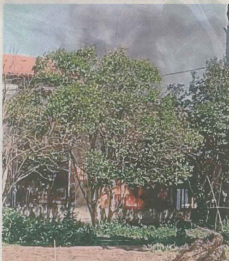
El foc va provocar una gran columna de fum

El Centre Educatiu El Segre, ubicat a la partida de Rufeia a Butsènit va patir ahir un incendi, tot i que gairebé no es van produir afectacions i el centre va continuar amb el seu funcionament habitual. Els Bombers van rebre l'avís a les 11.38 hores per un foc que s'havia declarat i que estava cremant algunes fustes i cadires de plàstic. Es van mobilitzar tres dotacions, que van apagar-lo amb rapidesa.