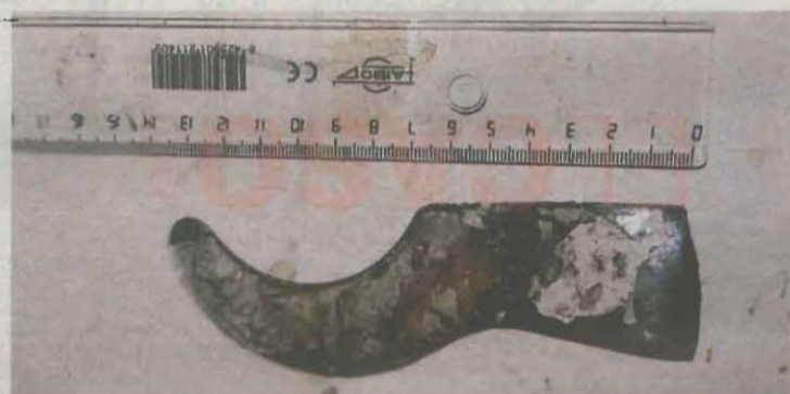
Peça del radiador que l'intern va utilitzar per fer el forat a la paret de la cel·la

Segons el sindicat, els serveis penitenciaris de la Generalitat "fan el ridícul novament en mostrar-se públicament la manca d'inversions en seguretat passiva" a Ponent i "l'estat lamentable d'aquesta infraestructura".