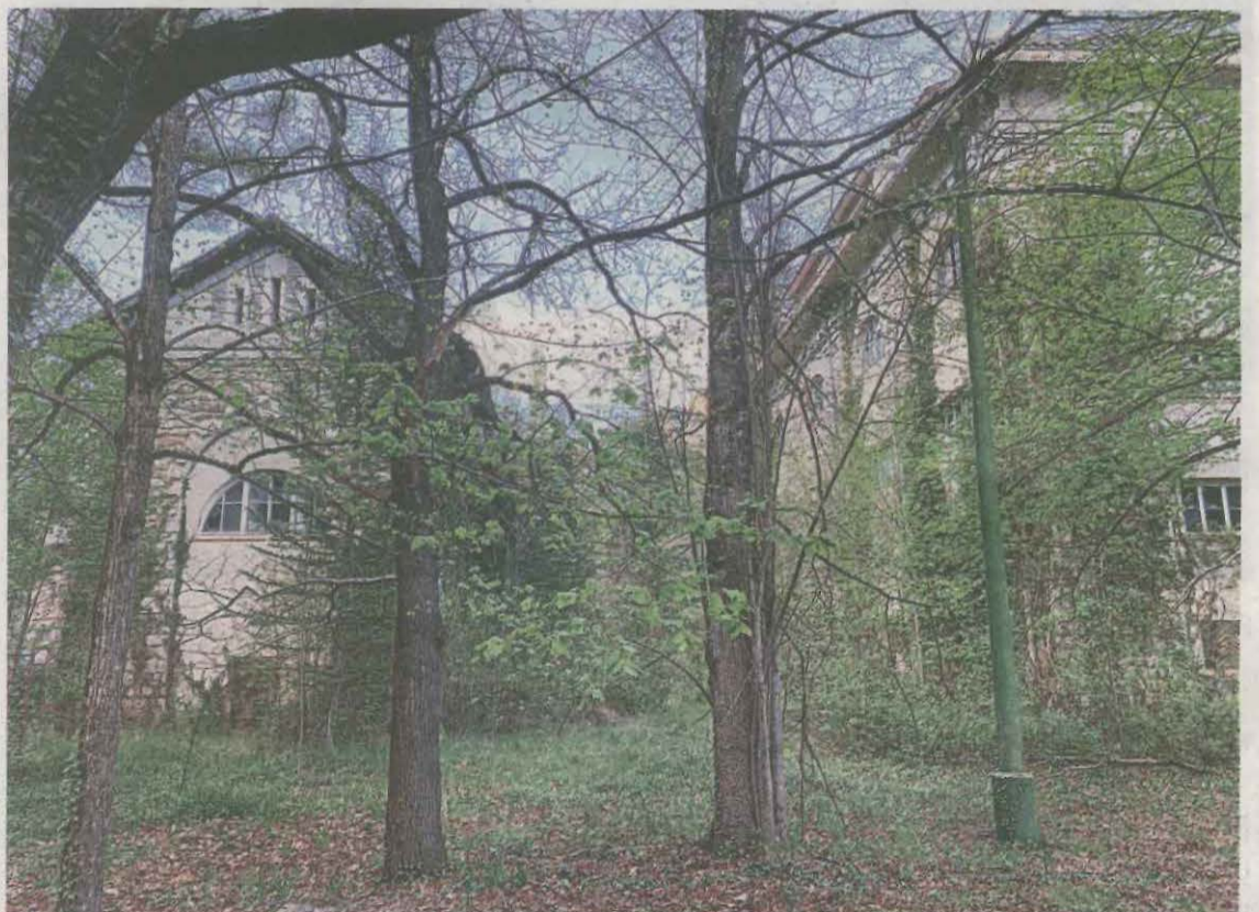
FOTO_ Aj. Torre de Capdella La previsió és rehabilitar dos habitatges per lloguer social

ges de treballadors, el teatre, i l'església. La previsió és rehabilitar els dos habitatges que hi havia en un dels edificis, per oferir-los amb un lloguer social i restaurar la resta d'equipaments, per donar resposta a necessitats de les persones del municipi.