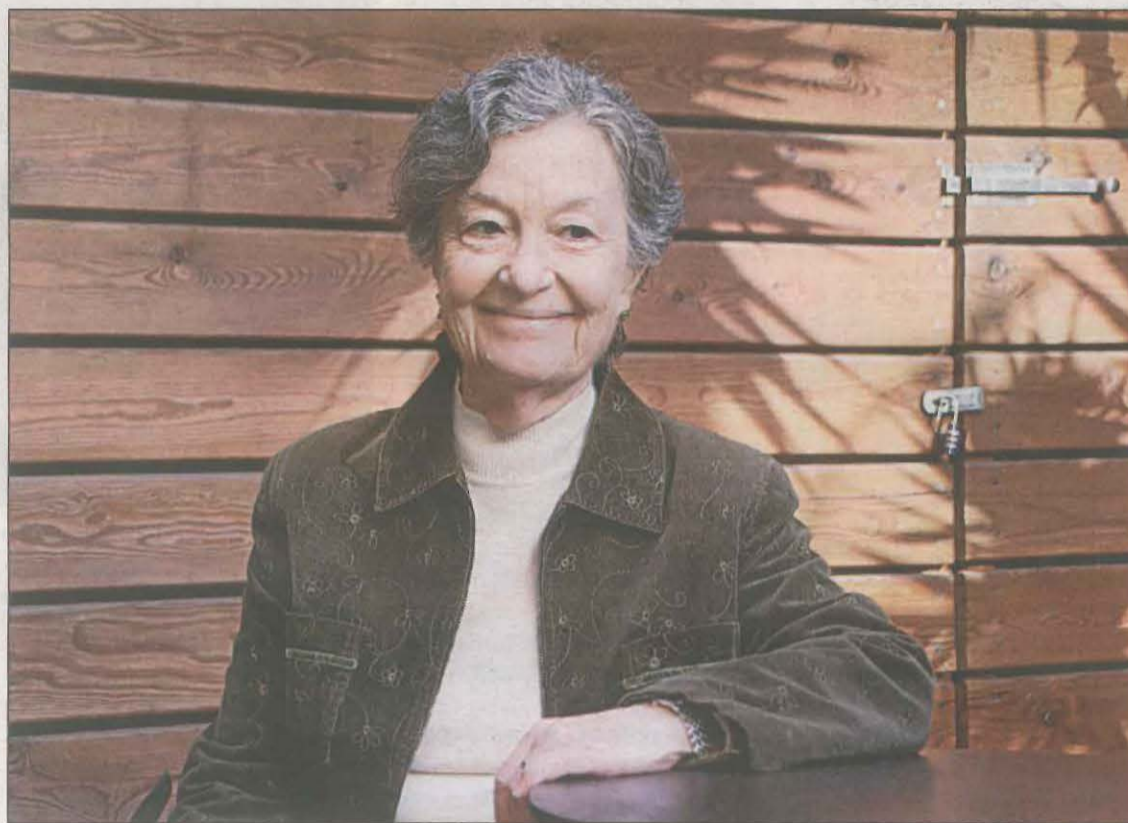
L'escriptora de Trepmp, va citar com a referents Mercè Rodoreda i Víctor Català