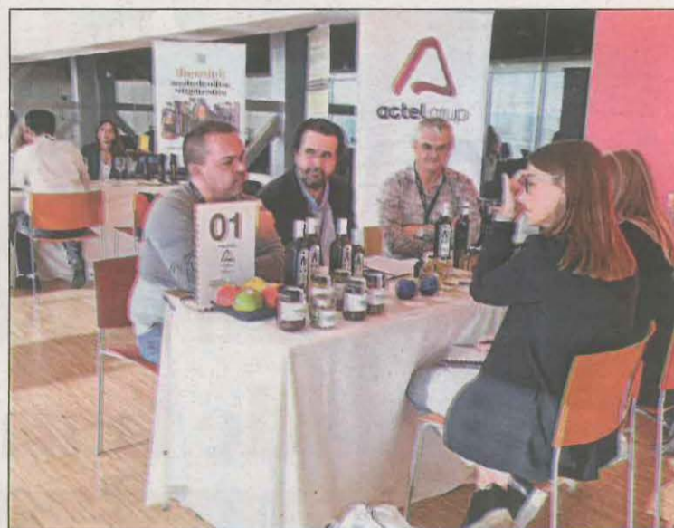
La Llotja va acollir reunions de productors i compradors

En el marc d'aquest esdeveniment, els compradors internacionals també han fet visites a diversos molins de les comarques de Ponent per conèixer la realitat del sector a casa nostra i se'ls ha ofert una proposta gastronòmica amb un menú centrat a ressaltar les característiques de sabor i aroma de l'oli d'oliva. El sector compta amb 347 empreses productores que facturen 863 milions d'euros i ocupen prop de 1.500 treballadors.