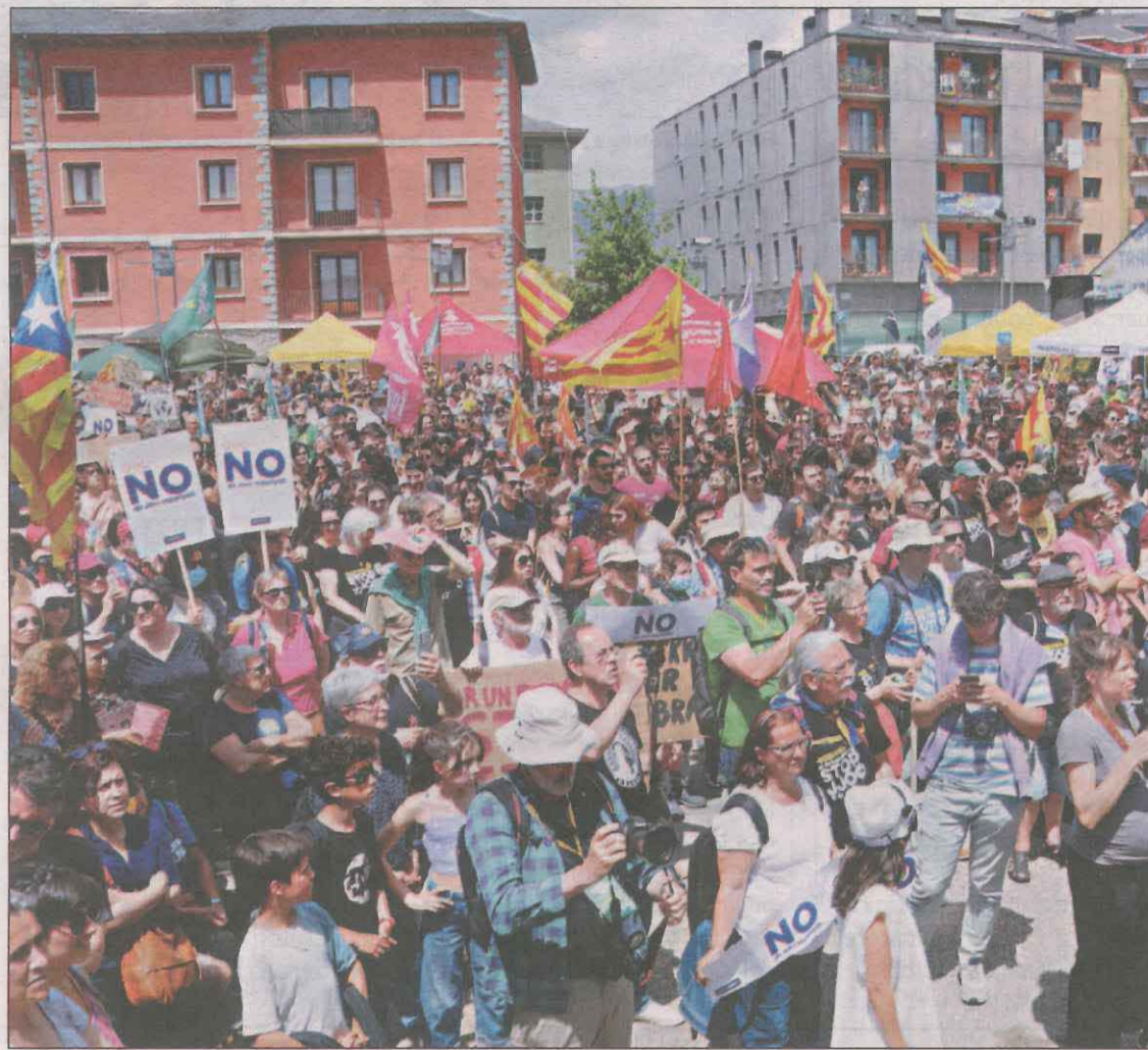
A la manifestació van participar unes 5.000 persones, segons els organitzadors

Durant el recorregut, els manifestants van cridar proclames com ara "No als Jocs, ni aquí ni enlloc" o "30 dies de festa, 30 anys de misèria", entre d'altres. Tot i que una part d'ells van arribar en vehicle privat, l'organització també havia mobilitzat una vintena d'autobusos des de diferents punts del país. A més, altres van optar per arribar-hi en tren. Des de la Plataforma Stop JJOO consideren que la mobilització ha estat un èxit i es van mostrar molt satisfets amb la bona resposta que va tenir la convoca-