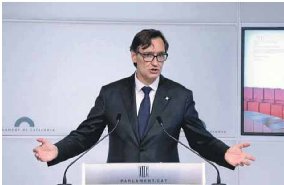
El primer secretari del PSC, Salvador Illa, ahir en la seva intervenció al Parlament

un exercici de responsabilitat en un tema molt rellevant, i en aquest sentit vull expressar el meu agraïment a totes les persones que l'han fet possible." El líder socialista va recordar, d'altra banda, que l'elaboració de l'acord no va ser curta: "No és una cosa que passa el vespre