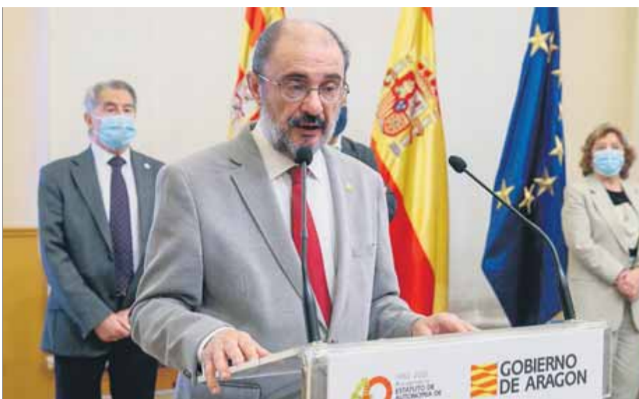
El president d'Aragó, dimarts, compareixia per rebutjar l'acord tècnic dels Jocs