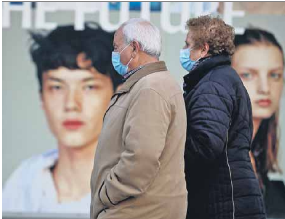
L'ús de la mascareta pot reduir-se a pocs supòsits després de Setmana Santa