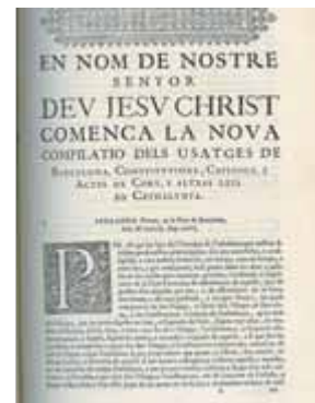
Reproducció de la compilació de les constitucions

Les constitucions catalanes van ser compilades per primer cop al segle XV. Les Corts reunides a Barcelona el 1413 ho van suggerir a Ferran d'Antequera, que acabava de ser coronat després del Compromís de Casp. A aquella primera recopilació, n'hi va seguir una altra el 1493, sota el regnat del seu successor, Ferran II el Catòlic, a les Corts de Barcelona celebrades aquell mateix any. Aquesta compilació es va imprimir en edició incunable de 1495, juntament amb els Usatges de Barcelona: Usatges de Barcelona, constitucions, capítols i actes de cort i altres lleis de Catalunya .