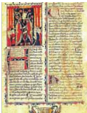
Fragment d'un dels 174 Usatges de Barcelona

Les primeres constitucions catalanes van ser promulgades en les Corts de Barcelona de 1283, sota el regnat de Pere II el Gran, després que el seu pare, Jaume I, ja hagués jurat fidelitat als drets i furs catalans davant dels representants dels nobles, els clergues i les ciutats, els tres braços socials que constituïen les Corts. Es van elaborar fonamentalment a partir dels Usatges de Barcelona (segles XI i XII) i també dels preceptes de les assemblees de pau i treva i són fruit del pactisme com a forma de govern singular en plena edat mitjana, ja que el rei legislava d'acord amb els estaments representats a les Corts.