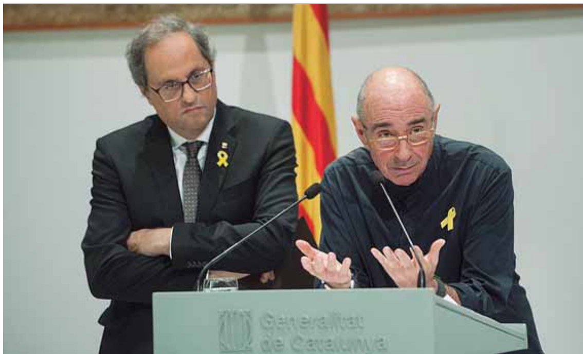
L'expresident Torra i Llach, presentant el Consell per a l'Impuls d'un Fòrum Cívic i Social l'octubre del 2018 ■ J. LOSADA

L'extracte dels resultats del qüestionari el farà un fòrum cívic i social que la Coordinadora Nacional hauria de crear el gener de l'any que ve, que prèviament ja haurà tingut la tabulació dels resultats, amb l'objectiu de decidir com es tracten aquelles qüestions amb el parer més dividit, fer l'aprovació de les propostes constituents i decidir com es presenten de manera pública i també al Parlament de Catalunya. Un procediment que validarà la Coordinadora Nacional i també les enteses territorials, amb la finalitat inicial que els representants polítics acabin convocant una assemblea o un parlament constituent. ■