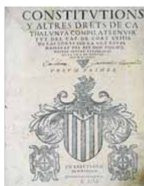
Primer volum, de tres, de les constitucions, editat el 1588

Des de Carlos I (1516) –net i hereu de Ferran el Catòlic–, els reis hispànics anaven a les Corts Catalanes per negociar l'aportació tributària catalana; a canvi, juraven respectar les constitucions de Catalunya, com el text legal que regulava la vida política, jurídica i econòmica del país. Felipe II ho va fer a les Corts de Montsó de 1585, amb una nova ampliació de les constitucions, primer cop editades en tres volums sota el títol: Constitucions y altres drets de Catalunya compilats en virtut del Capítol XXIII de les Corts per la S.C. y Reial Majestat del Rey don Philip nostre senyor celebrades en la vila de Montsó. Any M. D. LXXXV.