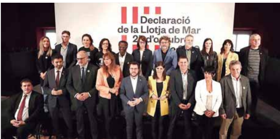
Alguns dels signants de la Declaració de la Llotja de Mar firmen ara un nou document