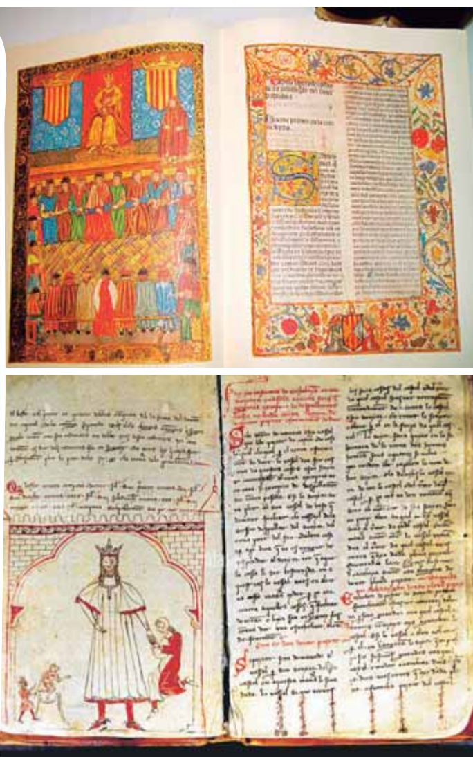
Constitucions catalanes promulgades i editades en tres volums el 1702. A la dreta, a dalt, edició incunable de les Constitucions de 1495. A sota, manuscrit del segle XIII-XIV dels Usatges de Barcelona

aquestes disposicions, puix que és nul el que vagi contra el dret paccionat.”