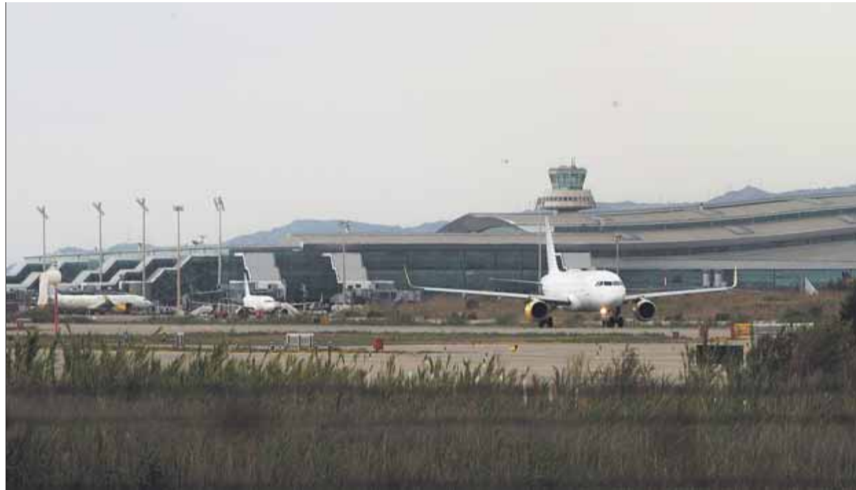
L'ampliació de l'aeroport s'ha de poder fer sense malmetre la llacuna de la Ricarda, segons Puigneró

"Sospito que el gobierno no va tenir mai un interès real en l'ampliació de l'aeroport", va assegurar el vicepresident després de desgranar cronològicament els esdeveniments des de la creació de la taula institucional per abordar l'ampliació del Prat, el 14 de juny passat, fins a les declaracions de Pedro Sánchez després de la reunió de la taula de diàleg quan va donar per "aparcada" la inversió a l'aeroport de Barcelona.