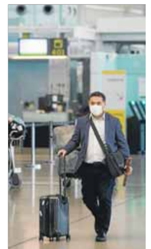
Els usuaris del Prat són la meitat dels del 2019

A Reus, la pèrdua de passatgers el setembre respecte del mateix mes del 2019 se situa en un 74,9% però creix un 742,8% més respecte del setembre del 2020. Els vols, un total de 1.286, van deixar un balanç negatiu d'un 32,2% menys que el 2019. ■