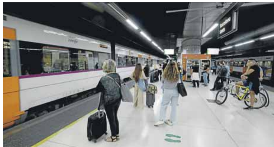
Andana de Sants durant la vaga de maquinistes de la setmana passada

Montero entregant el projecte de pressupost a Batet per a la tramitació