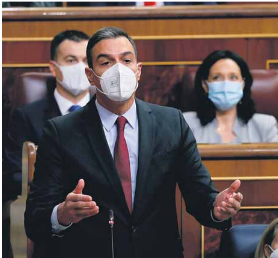
Pedro Sánchez, en la sessió d'ahir de control al Congrés

L'independentisme català i base sovint invoca que un dels seus motors de convenciment de crear un estat és l'extrema dreta, però ahir Sánchez els va voler donar la rèplica i va acusar els sobiranistes de fer el joc a Vox amb el seu qüestionament de la democràcia espanyola perquè això, segons ell, entronca amb el discurs que pregona Vox sobre que a Espanya hi ha un govern il·legítim i que deriva en l'escridassada rebuda pel president al passeig de la Castellana els moments previs i posteriors a la desfilarada del 12 d'octubre. A la galta de Bildu –i alhora pensant també en ERC, Junts, el PDeCAT i la CUP–, Sánchez va corregir el que s'entén pel dret a decidir: “El poble espanyol s'expressa en les tramitacions parlamentàries, en les esmenes que es presenten, en les votacions al Congrés sobre projectes