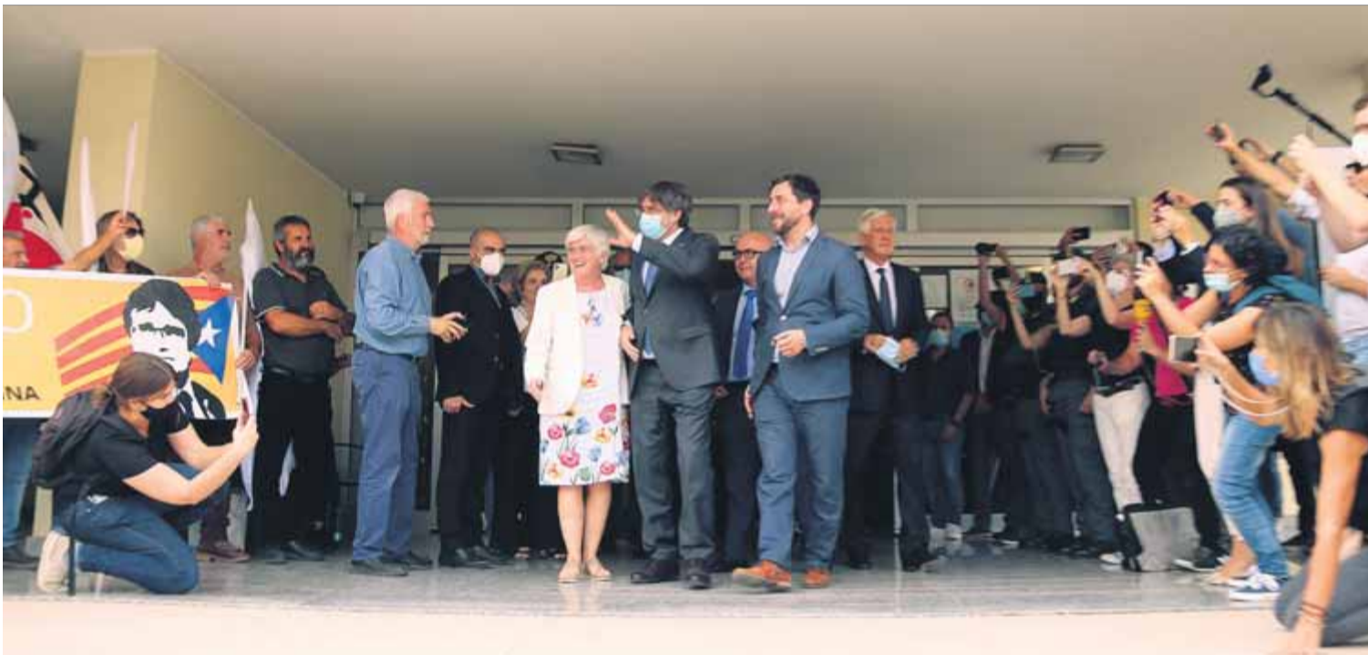
Els eurodiputats exiliats Clara Ponsatí i Toni Comín saludant Carles Puigdemont, al jutjat de Sardenya